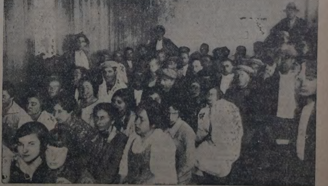
PARTE DE LOS ASISTENTES A LA REUNION DE AYER DE LOS HUELGUISTAS DE LA CASA Giardino.