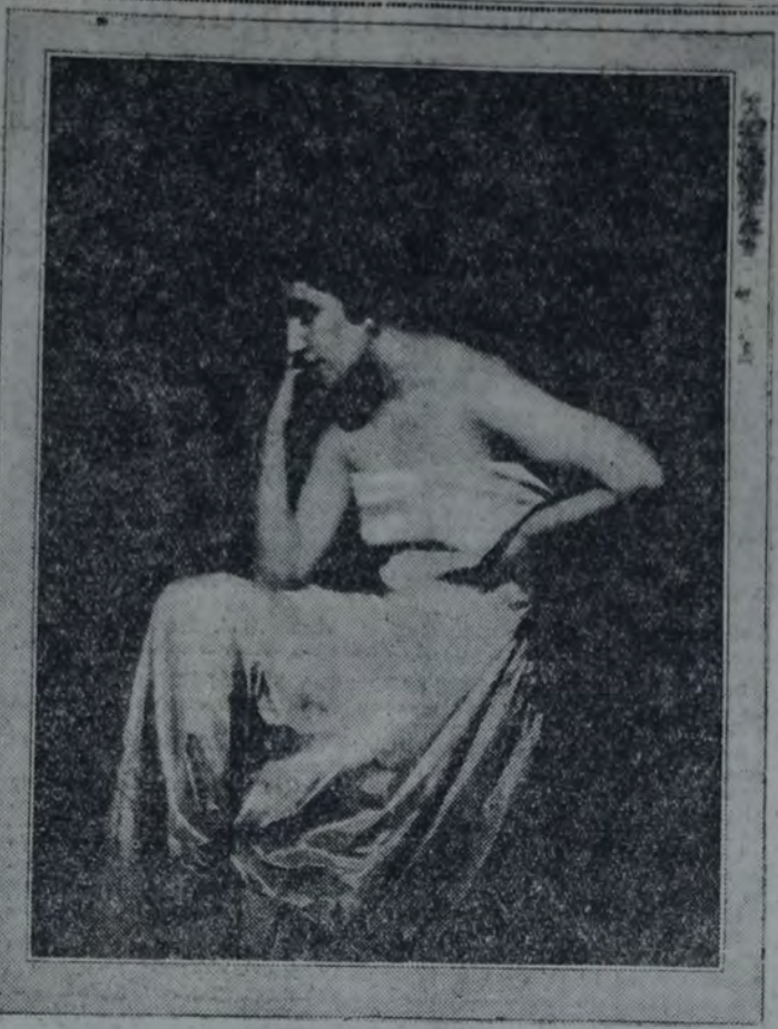
LA PRIMERA ACTRIZ DE LA COMPAÑIA DE DARIO NICCODEMI, QUE anoche celebró su función de honor y beneficio en el Odeón